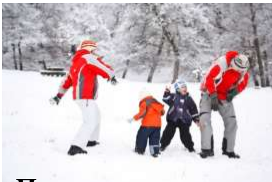
Прогулки на свежем воздухе