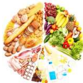
Правильное и здоровое питание