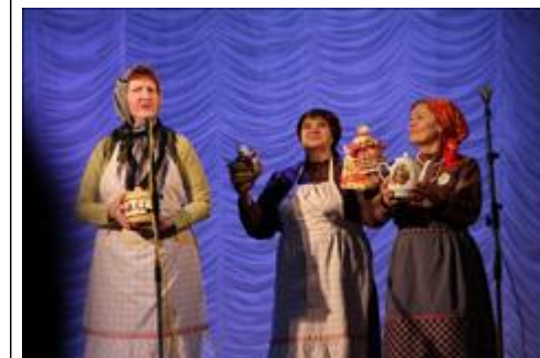
Презентация лучших практик Презентация проекта "Чайный домик на Сибирском тракте"