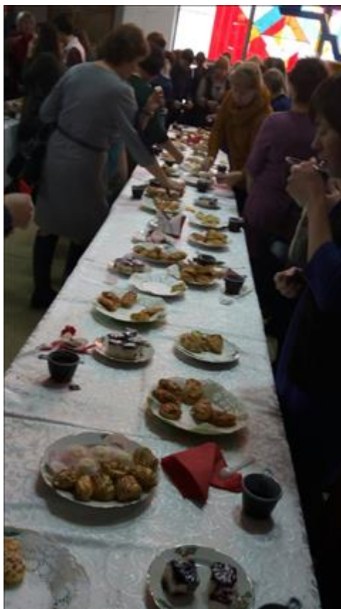
Кофе-брейк Кофе-брейк во время конференции 15.11.2018

Итоговое видео о всех мероприятиях ИРЦ "Сделано в Игре" --