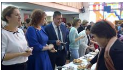
Кофе-брейк В перерыве работы конференции - кофе-брейк 15.11.2018